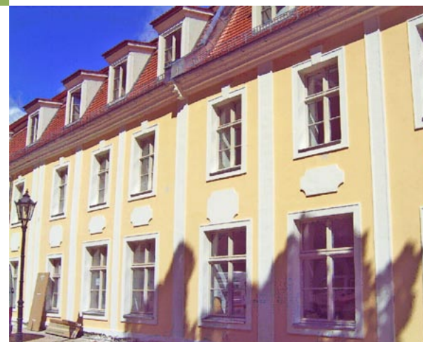
Das „Köppchenhaus“ in Luckau

Sollten Sie Häusliche Krankenpflege, Behandlungspflege oder Grundpflege benötigen, sind wir gerne bei der Vermittlung eines ambulanten Dienstes behilflich.