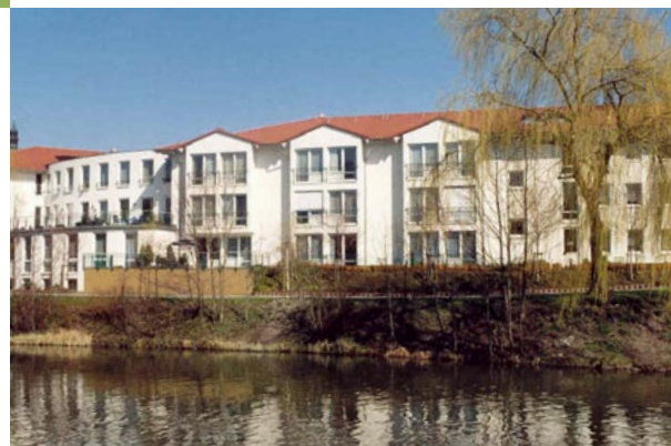
Ev. Seniorenzentrum Am Spreeweer Lübben

Die Evangelischen Seniorenzentren (ESZ) des LAFIM mit den Wohnformen Betreutes Wohnen im Heim oder am Heim: