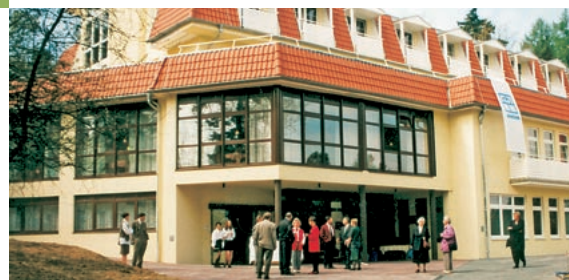
Hotel »Haus Chorin«