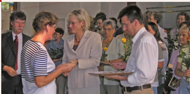
Wertschätzung der Ehrenamtlichen durch die Ministerin

Wir lassen uns von folgendem biblischen Grundsatz leiten: „Dient einander, ein jeder mit der Gabe, die er empfangen hat, als die guten Haushalter der mancherlei Gnade Gottes.“ (1. Petrus 4,10)