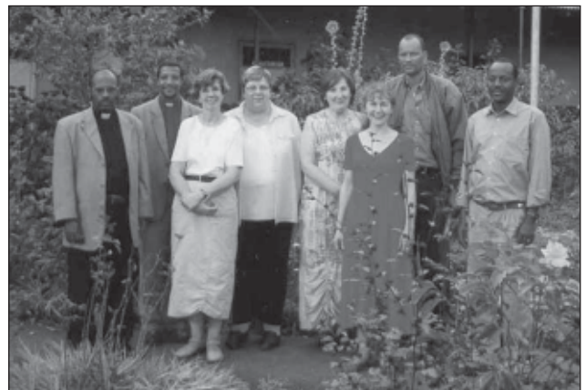
Mitarbeiter der Synode im Gebiet Chanka

Um 06.00 Uhr morgens holen uns 2 Mitarbeiter der Gudina-Tumsa-Stiftung ab, die uns nach Fantalle bringen. Fantalle liegt ungefähr 100 km östlich von Addis Abeba in einem ausgesprochen heißen und trockenen Gebiet. Wir werden vertraut gemacht mit dem, was durch die Gudina-Tumsa-Stiftung an diesem Ort für das Viehnomadenvolk der Karaju-Oromo getan wird. Dieses Gebiet wurde von der Gudina-Tumsa-Stiftung ausgesucht, um hier für die dort lebenden Karajus bessere Lebensbedingungen zu schaffen.