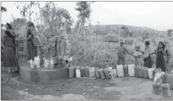
Anstehen für sauberes Trinkwasser

Sehr früh am Morgen brechen wir auf nach Addis. Dort werden wir am Nachmittag von alten Bekannten freudig erwartet und begrüßt.